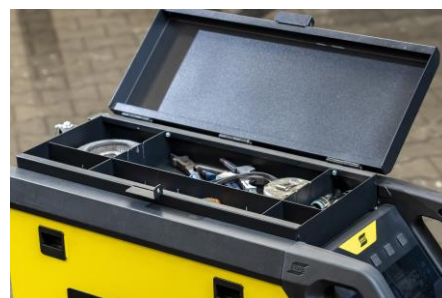
Opcjonalna górna skrzynka narzędziowa na akcesoria