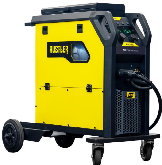
Rustler EM 350C PRO Synergic

Kompaktowe inwertorowe urządzenia Rustler MIG PRO to najlepszy wybór dla najbardziej typowych wyzwań spawalniczych. Wyposażone w najnowszą technologię inwertorową łączą niskie zużycie energii ze zoptymalizowaną wydajnością spawania.